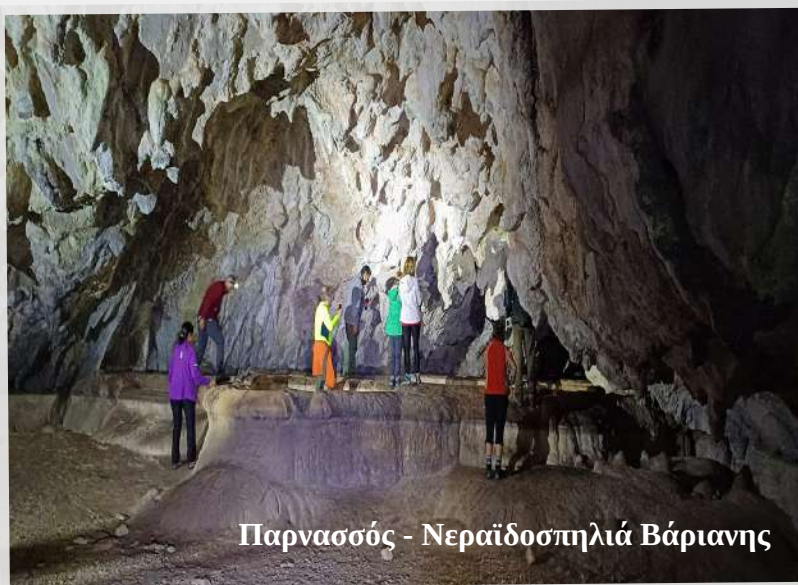
Παρναςός - Νεραΐδοσπηλιά Βάριανης